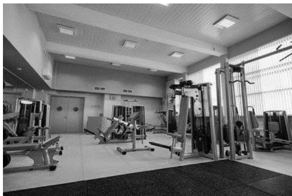
Рисунок 2 - Тренажерный зал в зелено-оранжевой цветовой гамме

Из всего комплекса вопросов, составляющих сложную проблему психологического воздействия цвета, для дизайнеров тренажерных залов особенно актуальны вопросы физиологических реакций человека на цвет и о цветовых ассоциациях (рисунок 2).