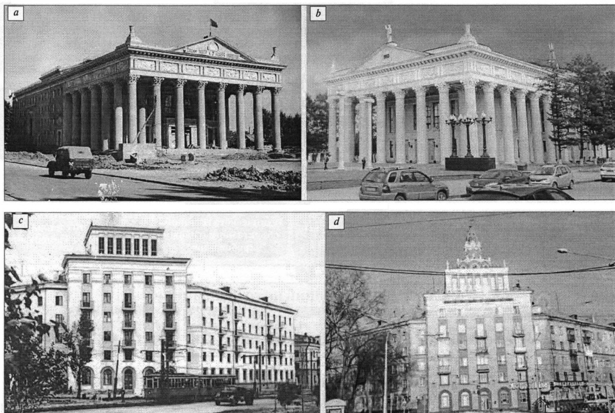
Рис. 3. Объекты третьего периода эпохи модернизма: а, б – Новокузнецкий драматический театр; с, д – жилой «дом геолога», г. Новокузнецк. Фото 1960-х гг. (а, б); фото 2020 г. (б, д)