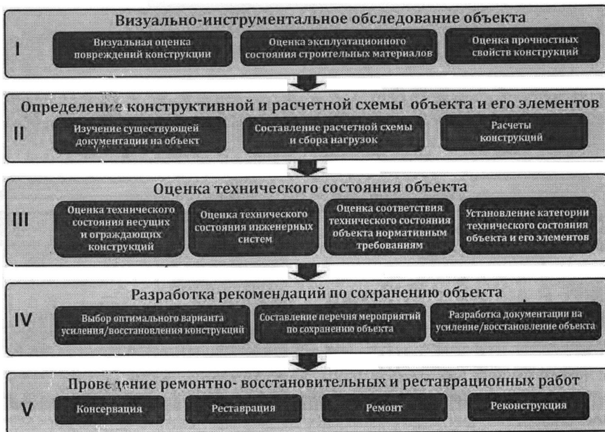
Рис. 4. Алгоритм последовательного проведения работ по обследованию, оценке и сохранению объектов культурного наследия эпохи модернизма