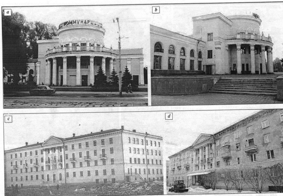
Рис. 2. Объекты второго периода эпохи модернизма: а, б – кинотеатр «Коммунар», г. Новокузнецк; с, д – дом в стиле сталинского ампира, г. Новокузнецк. Фото 1955 г. (а, с); фото 2019 г. (б, д) Fig. 2. Objects of the second period of the age of modernism: а, б – cinema «Kommunar», Novokuznetsk; с, д – House in the Stalinist Empire style, Novokuznetsk). Photo of 1955 (а, с); photo of 2019 (б, д)

Несущие стены зданий выкладывались на цементных и известковых растворах из полнотелого керамического кирпича. Жесткость продольных и поперечных каменных стен зданий, воспринимающих вертикальную нагрузку, обеспечивалась посредством установки скрытых связей из кованого железа. Перегородки делались деревянными (оштукатуренными с двух сторон по дранке) либо кирпичными. Перекрытия выполнялись по деревянным балкам с накатом из пластин или досок. Шаг между несущими балками, как правило, составлял 1–1,5 м. Стропильная система наклонного или висячего типа, характерная для скатных крыш, устраивалась обычно из бревен. Конструкции лестниц в большинстве зданий были решены в виде каменных или бетонных наборных ступеней, уложенных по стальным, а позднее и по железобетонным косоурам.